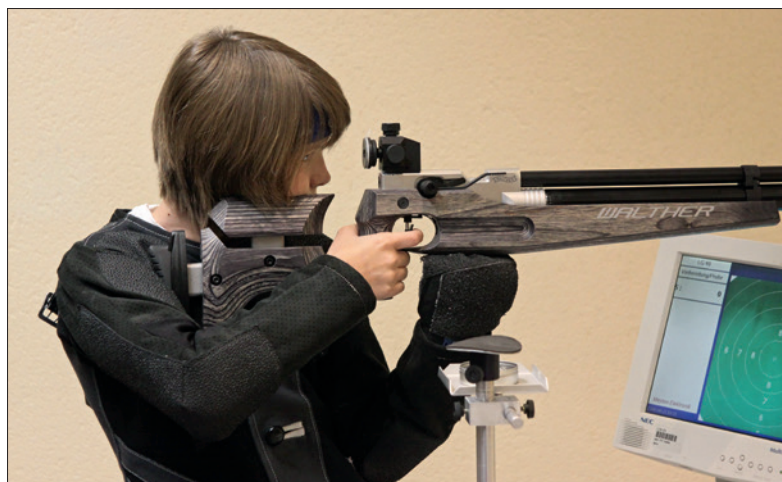
Detail Anschlag – die Option einer Visierhöhung gibt es wie bei allen „Junior-Modellen“ nur als gesondertes Zubehör.

voller Weise eine Punzierung. Für die Schaftanpassung kommt das bewährte Walther Speed System mit zwei auszugsbegrenzten Auslegern zum Einsatz. Deren Montage-Aufnahmen sind bemerkenswerterweise zusätzlich kunststoffbettet. Dazu Walther-Verkaufsführer Denny Brumbach: „Damit wurde der Schaft verstärkt und ist besser gegen Transportbrüche geschützt. Diesbezügliche Reklamationen sind gegen Null zurückgegangen.“ Nun, auch bei starkem Gebrauch wie in der Vereinsspraxis (Einstellung) dürfte die Bettung Haltbarkeitsvorteile zeigen.