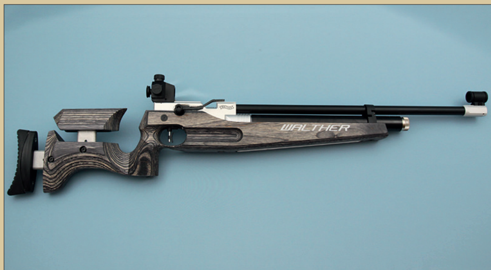
Das Walther LG 400 Junior Universal.