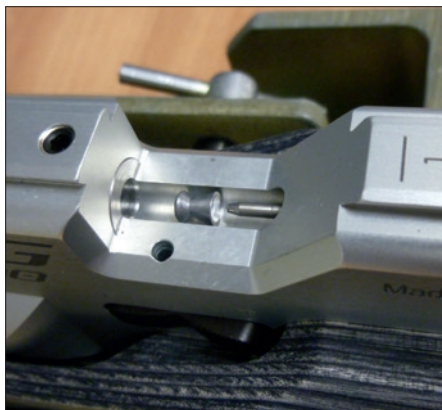
Diabolo Zuführung mit Laderinne und federgelagertem Zuführungsstift.

Im Fall der Junior sind die Alu-Ausleger sinnvoll kürzere, leider ohne den Detailkomfort einer Skalierung. Damit können sowohl die gebogte Schaftkappe als auch die universale Backenform im Anschlag angepasst werden. Denn die Mehrzahl der Einstellschrauben ist von außen zugänglich und mit nur einem Innensechskantschlüssel (vier Millimeter) einstellbar. Das beigegefügte Werkzeugtool ist inzwischen auch bekannt. Möglicherweise nutzt dessen Werkstoff sich im Gebrauch etwas schneller ab als die früheren losen Schlüssel, aber dafür hat man alle parat und spart die Zeit beim Hinterherschauen in den vereinseigenen Werkzeugboxen.