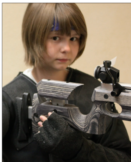
Einsetzen der Schaftkappe in der Schulter für den Rechtsanschlag, durch die universale Schaftgestaltung optional auch für Links möglich.

unserer Nachwuchs-Testschützen griff einfach drüber, ohne dabei einen Komfortmangel im Stehendanschlag zu bemerken. Ebenfalls jetzt griffig geformt sind die Stellknöpfe des Basic Diopters, deren schwarze Beschriftung – auf schwarzem Grund – bleibt aber auch für jugendlich sehkräftstarke Augen eine überflüssige Herausforderung.