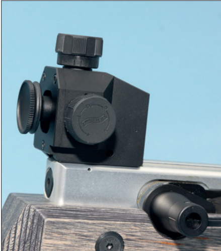
Der BASIC-Diopter mit komfortablen Stellknöpfen, jedoch fehlt der Beschriftung der Kontrast.

Erwartungsgemäß ließ sich das mit den bekannten Matchsorten (Gesamt 12 Lose/vier Hersteller/mindest. je zwei Mal fünf Schuss/Papierscheibe) schnell toppen: 6,5 Millime-