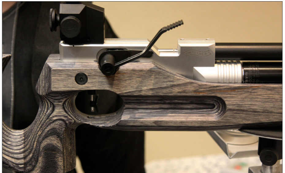
Das Herz des universalen Juniors – das 400er Pressluftsystem, zudem im Bild der punzierte Pistolengriff und der Schichtholz-Vorderschaft mit angerauter Oberfläche.

seitige Anschlussbild betrug fünf Millimeter mit Kopfgröße 4,49, eine Vorliebe für dieses Format bestätigte sich nicht. Die Junior Version hat einen hohen Qualitätslevel mit durchgängig guter Präzisionsleistung.