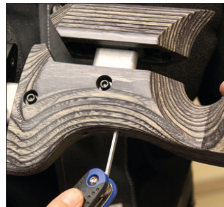
Vielfältige Möglichkeiten: Das Einstellen der Schaftbacke.

Dagegen ist der serienmäßige schwarze Walther Korntunnel innen auf lichtstarke 22 Millimeter Durchmesser gewachsen. Beim Vorgänger waren es noch 18 Millimeter. Auch hier wieder ein Lesbarkeitsdetail: Beim