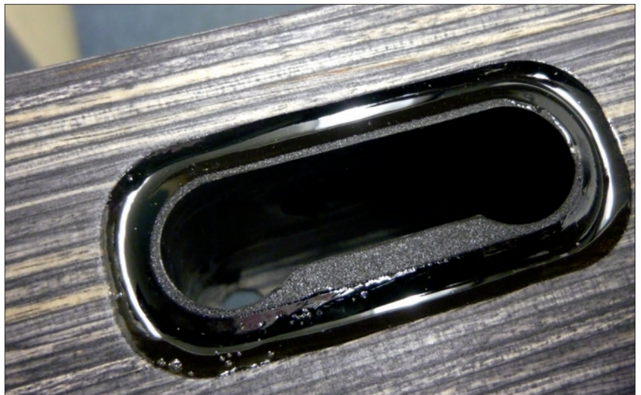
Die Aufnahme für das Auslegersystem ist zur Schaftverstärkung in Kunststoff gebettet.

Es wäre etwas falsch gelaufen, wenn an dieser Stelle stünde, „das Junior“ wäre Erwachsen geworden, denn dies bleibt ihm konzeptbedingt verwehrt. Dafür geht es klassisch attraktiv und komfortabel aufgestellt – bis auf kleine Details – in die nächste Modellgeneration. ■