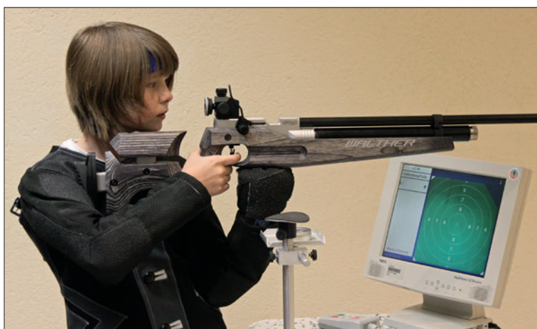
Das Junior im Anschlag.

der Pistolengriff den Zusatz Universal in der Modellbezeichnung ebenso wie die analoge Gestaltung der Schaftbacke. Und während die Backenoberfläche bewusst glatt ausgeführt wurde, findet sich am Pistolengriff sinn-